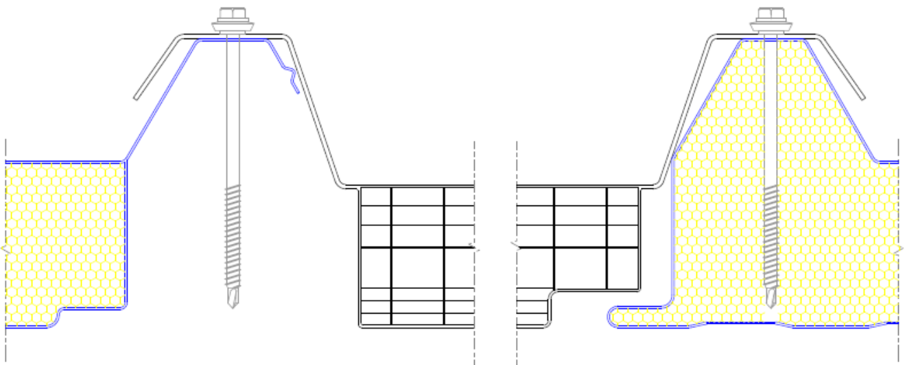
DETALLE DE ENCAJE CON PANEL DE POLIURETANO DE 40mm ESCALA 1:1